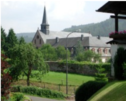
Abtei St. Thomas

Wanderzettel 54 W49 2003 Südeifel St. Thomas