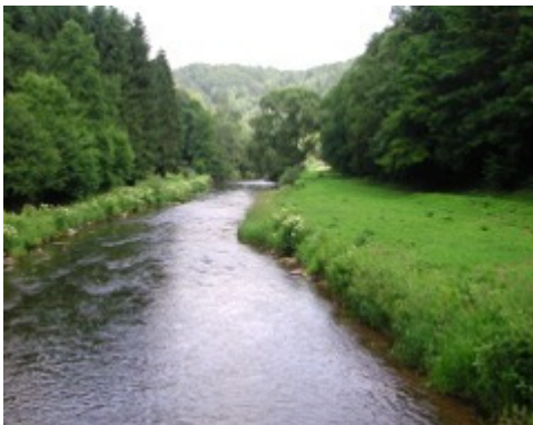
Kylltal bei Kyllburg

Nach ca. 1,5 km an der Wegkreuzung hinter dem Steinkreuz rechts auf dem asphaltierten Weg weiter abwärts (Schild Malberg). Kurz hinter dem Waldrand die Georg Zahnen-Hütte mit Blick zum Schloss Malberg. Leider ist der Blick im Sommer schon etwas zugewachsen. Am Ortsanfang von Malberg treffen wir auf den EV-Weg 4, dem wir an der Kirche vorbei bis hinter die Steinbrücke über die Kyll folgen.